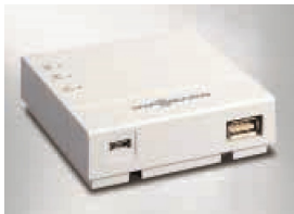
Vitoconnect 100 avec branchements pour le bloc d'alimentation (à gauche) et pour la liaison de données

L'application mobile ViCare propose de nouvelles fonctionnalités de pilotage à distance des installations de chauffage. Elle a été spécialement développée pour le particulier.